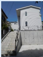
新ホーム全景写真

丘陵に面したホームのため入り口までリフトを設置し、移動負担への配慮をしました。防火防災面では全室に火災報知器とスプリンクラーを設置し、非常時には自動的に消防署に通報が行くシステムが構築されています。