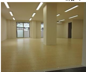
2階「デイリー」フロアー