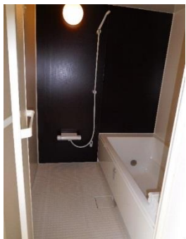
バリアフリー浴槽