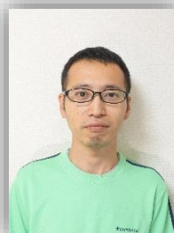
①お名前 ②趣味 ③一言お願いします♪