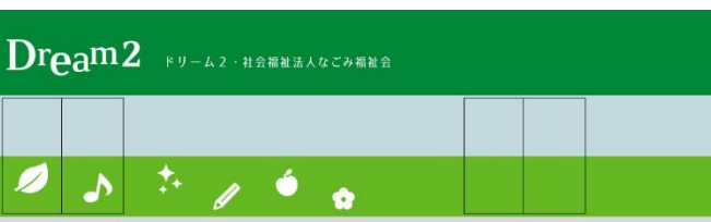
※外観イメージ写真