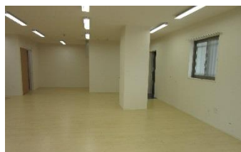
1階「フローラ」フロアー