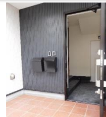
玄関エントランス