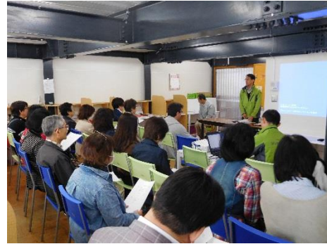
事業部長より、新年度の事業計画についてお話をしています

次の家族会は11月を予定しております。次回も多く方のご参加を心よりお待ちしております。