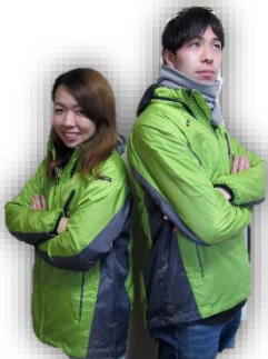
新しい年度のはじまり♪ 28年4月より導入開始