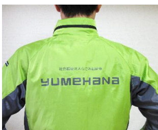
背中プリントには「なごみ福祉会 yumehana」のロゴが入っています

今年度よりスタッフジャンパーを導入しました！ スタッフジャンパーのメリットは①多くの人に夢花の職員であるという事を知ってもらえること ②一体感を生むためのツールでもある、です。 今年度も新たな気持ちでがんばります！