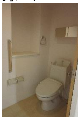
バリアフリートイレ