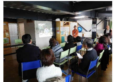
工房の担当者より、日頃の活動報告をしています