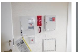
自動火災報知設備