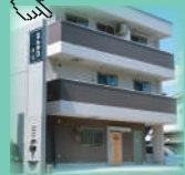
夢花工房フローラ (デイリー)