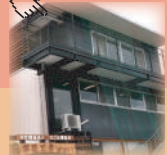
夢花工房ぼぱい (フルール)