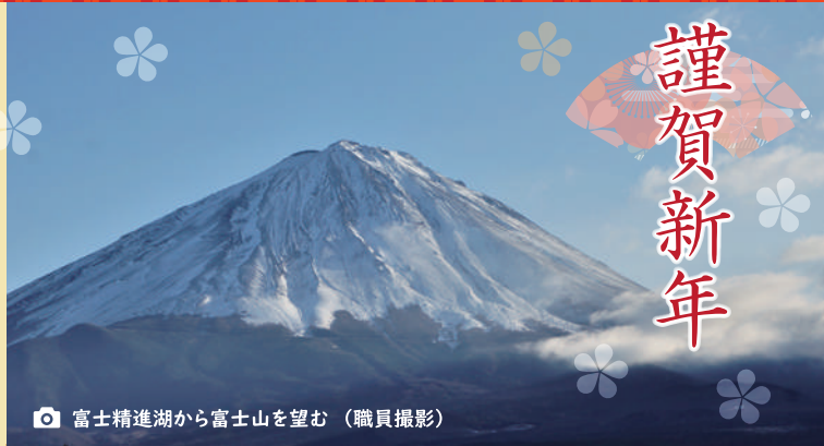
富士精進湖から富士山を望む

夢花とせせらぎの両事業部が共同して活動をする体制となって2年、新施設の建設と運営という新たな課題も加わりました。「不易流行（ふえきりゅうこう）」という言葉が意味する「いつまでも変化しない本質的なものを忘れない中にも、新しく変化を重ねているものを取り入れていくこと」が、混迷を深める社会情勢の中で、利用者と職員の生活を守る為の事業運営と継続には欠かせません。守るべき事と改めるべき事を真摯に検討しながら、積極的に取り組んで参りますので宜しくお願い致します。