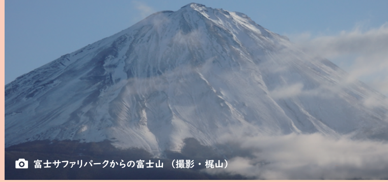
富士サファリパークからの富士山

編集発行 ■ 社会福祉法人なごみ福祉会 夢花事業部 住所 ■ 川崎市多摩区長沢 4-2-9-402 TEL 044(742)2555 WEB ■ nagomi-yumehana.com MAIL ■ office@nagomi-yumehana.com