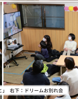
写真上：始まりの会 左下：新施設「ひとと」 右下：ドリームお別れ会