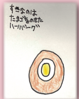
▲五七五にイラストを添えた作品