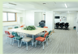
▲「ひとと」の内観画像

今日まで、ご指導とご協力を頂いた多くの方々に感謝を申し上げるとともに、皆様の御指導とご鞭撻を改めてお願い申し上げます。