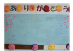
▲みんなで書いた寄せ書き