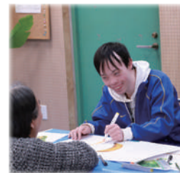
▲アート制作、笑顔のひとコマ

発行■社会福祉法人なごみ福祉会 夢花事業部事務局 川崎市多摩区長沢 4-2-9-402 TEL 044(742)2555 MAIL yume-jimukyoku@nagomisocial.onmicrosoft.com