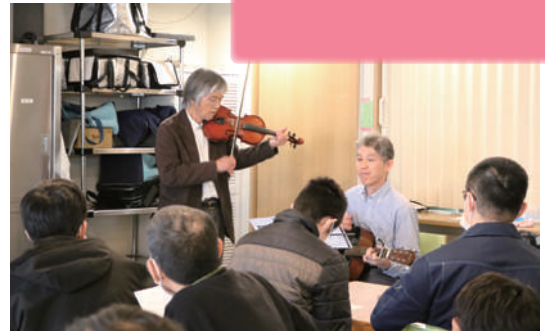
「世界に一つだけの花」を合唱 ♪