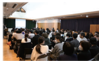
▲会場風景・あゆ工房ホール

保育部・障害部あわせ約90名が受講し、被害時の対応やハラスメント防止など多くの事例を交えた分かりやすい内容で、学びの多い充実した時間となりました。(中村)