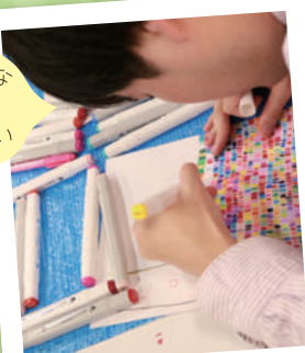
アートに気持ちを込めて