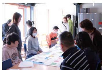
みんなでアート制作の時間